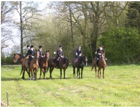
C'est vrai qu'ils sont beaux les membres du rallye TEMPETE.